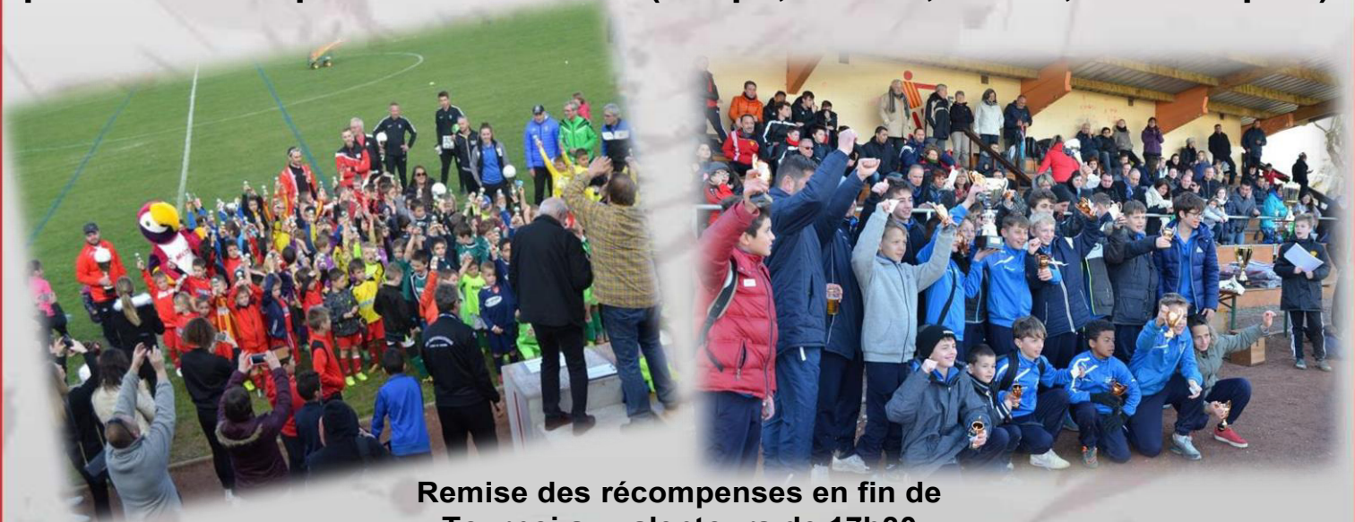
Remise des récompenses en fin de Tournoi aux alentours de 17h30

Le tournoi récompensera chaque équipe, mais aussi chaque participant par une récompense individuelle (coupe, maillot, ballon, sac de sport).